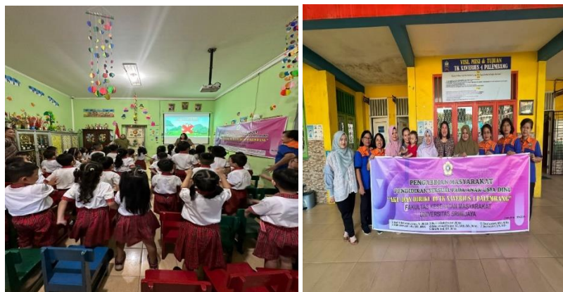
Gambar 3. Bernyanyi dan Menari Bersama mengenai sentuhan Boleh dan Tidak boleh

Gambar 3 menunjukkan kegiatan Bernyanyi dan Menari Bersama mengenai sentuhan Boleh dan Tidak boleh. Lagu ini memberi tahu bagian tubuh dan fungsinya. Edukasi seksual membantu anak untuk lebih memahami tentang tubuh dan membantu mereka mencintai tubuh mereka sendiri. Sebelum masuk usia remaja, berikan edukasi seks mengenai area tubuh. Sebagai contoh, mungkin bisa mengenalkan Bagian tubuh yang boleh disentuh dan tidak boleh disentuh. Di samping itu, disini disampaikan pada anak bahwa tidak ada yang boleh menyentuhnya tanpa izin, baik teman sebaya, guru, atau orang dewasa lainnya. Tak lupa, memberitahu anak bahwa bagian-bagian tubuh tertentu sebaiknya tidak disentuh oleh siapapun.