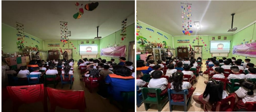
Gambar 2. Pemutaran Video cerita dari UNICEF tentang menghindari kekerasan seksual pada anak.

Gambar 2 menunjukkan Pemutaran Video cerita dari UNICEF tentang menghindari kekerasan seksual pada anak. Isi cerita video mengajarkan bagian tubuh yang tak boleh disentuh oleh sembarang orang, seperti dada, perut, penis atau vagina, dan bokongnya. Video juga mengajarkan anak bila ada yang menyentuh bagian tersebut, ia harus memberitahu orang tuanya serta Memberikan pengetahuan tentang pakaian seperti malu kalau tidak pakai baju, malu kalau kelihatan bokongnya. Jadi berikan pakaian ke anak sejak dini dengan sopan dan menutup.