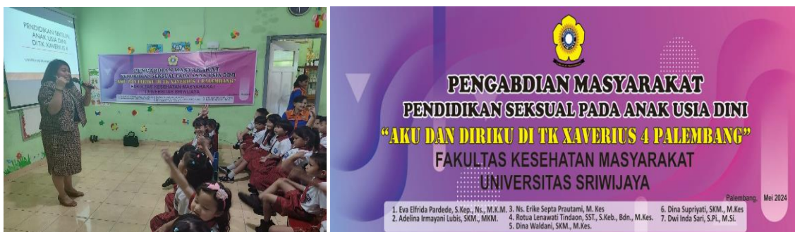
Gambar 1. Pemaparan materi terkait Pendidikan Seksual Pada Anak Usia Dini

Gambar 1 menunjukkan Pemaparan materi terkait Pendidikan Seksual Pada Anak Usia Dini Dengan edukasi seks yang diberikan sejak dini, maka anak akan lebih bertanggung jawab terhadap diri sendiri dan anak tidak akan merasa canggung. Pendidikan seks pada anak sangat penting untuk dilakukan, bahkan sejak usia dini dan orang tua berperan penting dalam proses edukasi seks tersebut. Dalam dunia pendidikan pun, mungkin anak akan mendapatkan informasi seputar sistem reproduksi dan pendidikan seks pada anak. Dengan pendidikan seks pada anak