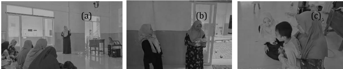
Gambar 2. Pelaksanaan kegiatan pelatihan penanganan kegawatan anak dengan aktifitas (a) edukasi (b) simulasi pemosisian bayi kejang dan (c) simulasi heimlich manuver

Kegiatan pelatihan penanganan kegawatdaruratan anak di rumah telah dilaksanakan dengan melibatkan 27 ibu anggota Pimpinan Cabang 'Aisyiyah (PCA) Pakusari. Pelatihan dirancang menggunakan pendekatan edukasi interaktif dan simulasi praktik untuk menjawab rendahnya pengetahuan dan keterampilan ibu dalam mengenali tanda bahaya serta melakukan pertolongan pertama pada kasus kejang demam, tersedak, dan diare dengan risiko dehidrasi.