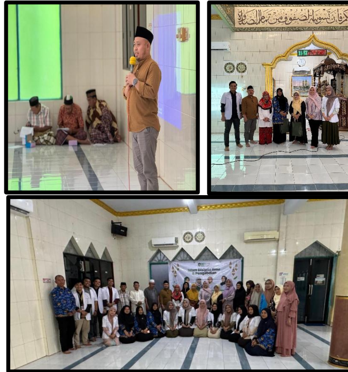
Gambar 2. Pemberian Cenderamata dan Foto Bersama

dipaparkan. Kegiatan ini bertujuan untuk memperdalam pemahaman masyarakat terhadap informasi yang telah diberikan. Permasalahan yang masih banyak ditemukan saat ini ialah terbatasnya pengetahuan mengenai upaya pemeliharaan kesehatan gigi dan mulut pada anak. Sesudah kegiatan penyuluhan selesai dilaksanakan, rangkaian acara ditutup dengan penyampaian penjelasan singkat oleh dosen pembimbing, dilanjutkan dengan pendistribusian konsumsi kepada masyarakat yang hadir serta penyerahan cenderamata kepada pihak setempat. Kegiatan kemudian diakhiri dengan sesi dokumentasi bersama seluruh peserta yang terlibat dalam pelaksanaan pengabdian ini.