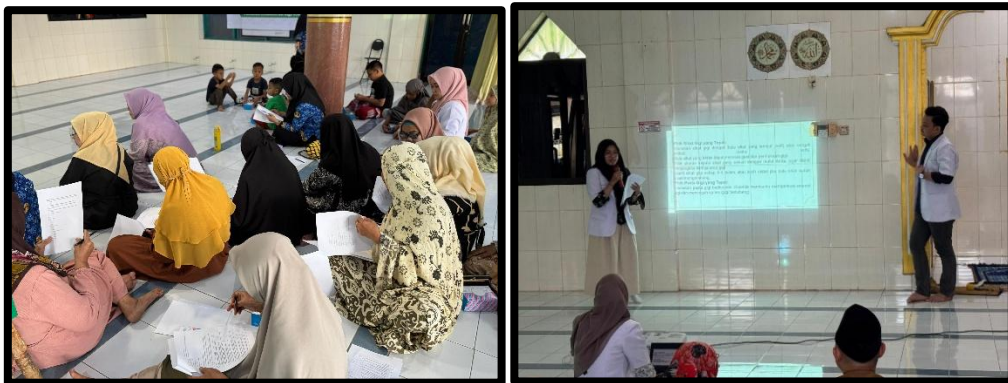
Gambar 1. Kegiatan Pembagian Kuesioner Responden, Edukasi, dan tanya jawab

Tahapan berikutnya berupa implementasi kegiatan pengabdian yang diawali dengan susunan acara pembukaan, meliputi pengantar oleh pemandu acara, pembacaan ayat suci Al-Qur'an, penyampaian sambutan dari Ketua Majelis Taklim, Wakil Dekan IV FKG-UMI, dosen pembimbing, serta penutupan rangkaian seremoni. Sesudah itu, kegiatan inti dimulai dengan pendistribusian kuesioner kepada masyarakat yang berpartisipasi. Langkah tersebut dilakukan untuk mengidentifikasi kontribusi ibu dalam upaya pemeliharaan kesehatan gigi anak. Kegiatan ini diikuti oleh sejumlah anggota Majelis Taklim dan memperoleh dukungan dari sekitar tiga orang dosen FKG-UMI beserta beberapa mahasiswa profesi klinik Fakultas Kedokteran Gigi Universitas Muslim Indonesia.