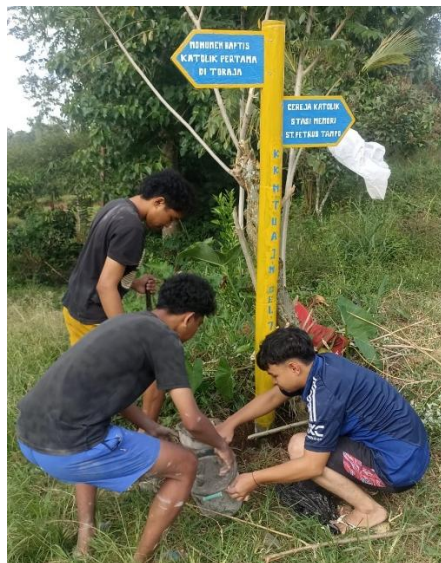
Gambar 2. Pembuatan papan penunjuk arah

Keberadaan papan penunjuk arah berfungsi sebagai elemen tourism infrastructure yang mendukung kemudahan akses ( accessibility ) dan kenyamanan wisatawan dalam menjangkau suatu destinasi. Menurut United Nations World Tourism Organization , aksesibilitas yang baik merupakan salah satu komponen utama dalam meningkatkan daya saing destinasi wisata karena memengaruhi keputusan kunjungan dan kepuasan wisatawan (UNWTO, 2018).