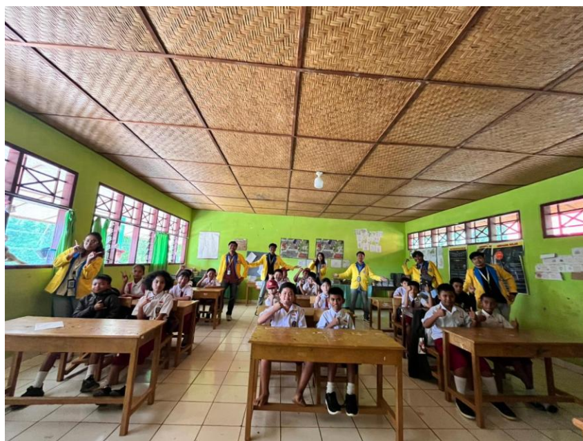
Gambar 3. Program Edukasi Siswa SD

Secara konseptual, kegiatan seperti kelas literasi dan numerasi, edukasi karakter, pelatihan teknologi, serta kesehatan mencerminkan pendekatan holistic education , yaitu pengembangan siswa secara menyeluruh mencakup aspek kognitif, afektif, dan psikomotorik (Miller, 2007). Menurut UNESCO, keterlibatan komunitas dalam pendidikan merupakan faktor kunci dalam meningkatkan efektivitas dan keberlanjutan program pendidikan, terutama di wilayah dengan keterbatasan sumber daya (UNESCO, 2015). Kolaborasi antara mahasiswa, pemerintah lokal, dan masyarakat juga memperkuat modal sosial ( social capital ) yang berperan dalam keberhasilan intervensi pendidikan. Secara umum, seluruh program terlaksana sesuai rencana dengan dukungan penuh dari pemerintah kelurahan dan masyarakat. Kendala seperti keterbatasan alat dan transportasi dapat diatasi melalui kerja sama dan swadaya.