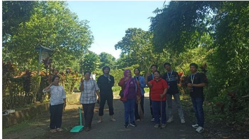
Gambar 1. Jumat Bersih