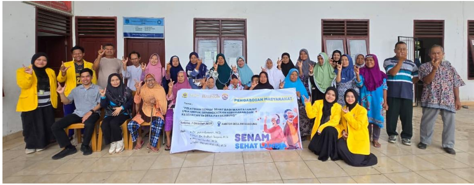
Gambar 4. Foto Bersama