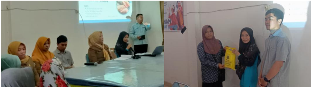
Gambar 1. Sambutan dan Penyerahan Souvenir

Selanjutnya adalah sambutan dari pihak tim pengabdian yang diwakilkan oleh salah satu dosen pelaksana, menyampaikan bahwa kegiatan ini merupakan bentuk kepedulian Universitas Sriwijaya terhadap masyarakat sekitar kampus dan upaya memenuhi tri dharma perguruan tinggi, dengan harapan mampu memberikan manfaat khususnya dalam hal ini kepada para lansia Desa Payakabung. Setelah sambutan-sambutan, acara berikutnya adalah penyerahan buah tangan dari pihak tim pengabdian kepada pihak desa. Berikut dokumentasinya.