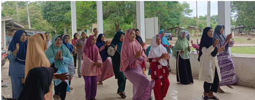
Gambar 3. Praktek Latihan Bersama

Pelatihan senam sehat untuk para lansia dilakukan di teras Balai Desa Payakabung dengan dipandu oleh beberapa anggota tim pengabdian. Senam yang diajarkan adalah jenis senam dengan gerakan yang santai dan cenderung mudah sehingga diharapkan para lansia yang ada dapat mempraktekannya dengan mudah pula di rumah masing-masing. Kegiatan praktek berjalan dengan lancar, para peserta juga antusias saat melakukan senam bersama. Berikut dokumentasinya.