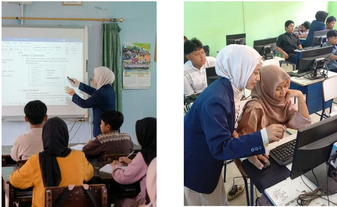
Gambar 4. Penyampaian materi & membimbing peserta didik

Gambar di atas adalah dokumentasi ketika sedang menyampaikan materi penggunaan Microsoft Word kepada para peserta didik yang dilakukan di dalam ruang laboratorium komputer dan juga saat sedang membimbing peserta didik dalam praktik menggunakan Microsoft Word.