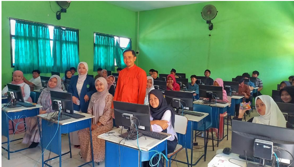
Gambar 6. Penutupan kegiatan

Gambar di atas adalah dokumentasi penutupan kegiatan pelatihan dan bimbingan penggunaan Microsoft Word di laboratorium komputer bersama seluruh peserta didik.