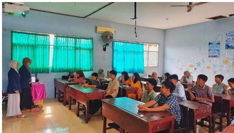
Gambar 3. Pengondisian siswa sebelum memulai praktik di lab. komputer.

Secara menyeluruh, hasil pengabdian masyarakat ini menunjukkan bahwa pelatihan penggunaan Microsoft Word dapat menjadi salah satu strategi yang efektif dalam meningkatkan keterampilan akademik siswa, khususnya dalam penyusunan makalah. Kegiatan ini tidak hanya memberikan peningkatan keterampilan teknis dalam penggunaan aplikasi pengolah kata, tetapi juga mendorong terbentuknya kesadaran baru mengenai pentingnya literasi digital dalam proses pembelajaran (Sugiyono, 2013). Dengan demikian, program pelatihan serupa dapat dikembangkan lebih lanjut sebagai bagian dari upaya peningkatan kualitas pendidikan serta penguatan kompetensi digital siswa di tingkat sekolah menengah pertama.