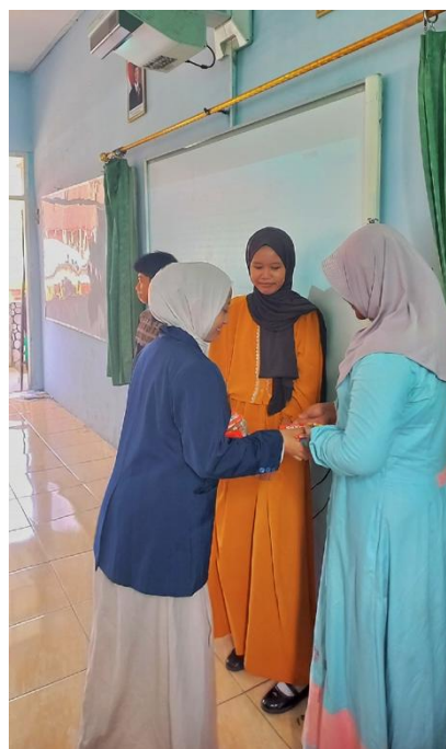
Gambar 5. Pemberian reward

Gambar di atas adalah dokumentasi ketika sedang menyampaikan materi penggunaan Microsoft Word kepada para peserta didik yang dilakukan di dalam ruang laboratorium komputer dan juga saat sedang membimbing peserta didik dalam praktik menggunakan Microsoft Word.