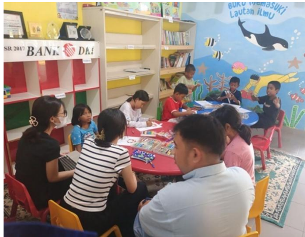
Gambar 1. Pelaksanaan Psikoedukasi Body Safety Education

membimbing peserta untuk merespons situasi berisiko secara langsung dan membangun kepercayaan diri anak dalam mempraktikkan keterampilan perlindungan diri.