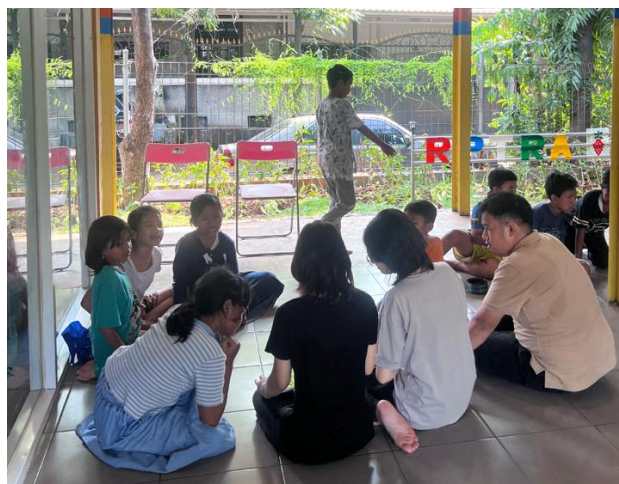
Gambar 2. Pelaksanaan Pengukuran Pemahaman Akhir

Tahap evaluasi dilakukan melalui pengukuran pemahaman akhir menggunakan instrumen yang sama dengan pengukuran pemahaman awal untuk mengukur perubahan pemahaman anak pada lima aspek yang telah disebutkan sebelumnya, yaitu pengenalan sentuhan aman dan tidak aman, pemahaman aturan keselamatan umum, kewaspadaan terhadap modus pelaku, keterampilan menolak, serta keterampilan melapor kepada orang dewasa terpercaya. Selain itu, evaluasi juga dilakukan melalui observasi terhadap keterlibatan dan respons peserta selama program berlangsung, meliputi antusiasme mengikuti kegiatan, keberanian menjawab pertanyaan, serta kemampuan memahami materi yang disampaikan. Kombinasi antara instrumen terstandar dan observasi langsung digunakan untuk memperoleh gambaran yang lebih menyeluruh mengenai efektivitas pendampingan yang diberikan.